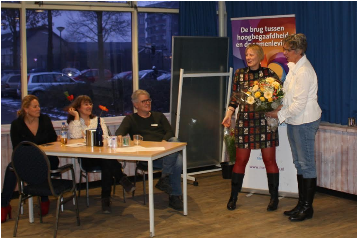
Foto: Sfeerfoto benefietveiling