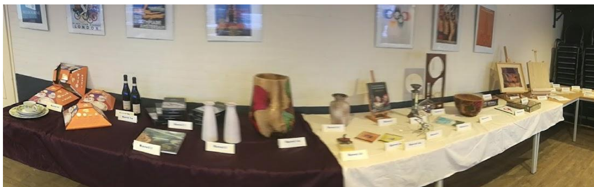
Foto: Kavels benefietveiling

De Club van 100 zorgde in 2017 voor een bijdrage van € 3.000 (in 2016 was dit € 2.900)